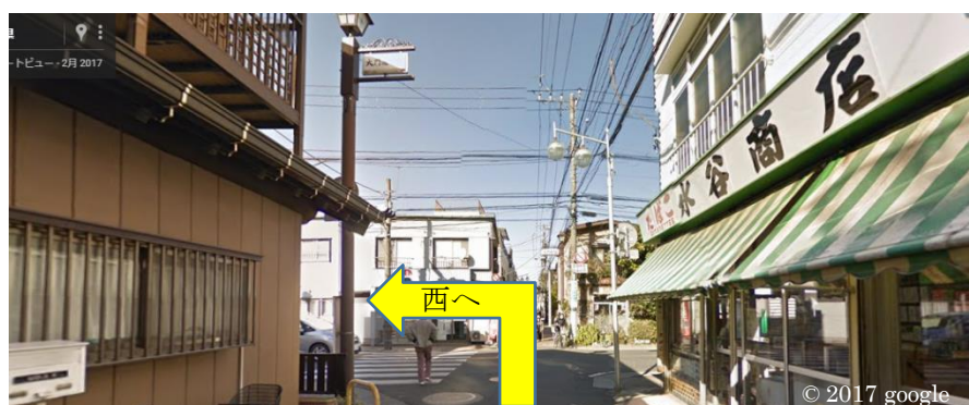
大門通りとバス通り（市川真間通り）の交差点（信号あり）