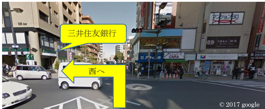
国道14号線 市川駅前の交差点