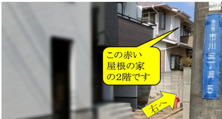
さらに細い路地を右に入るところの電柱