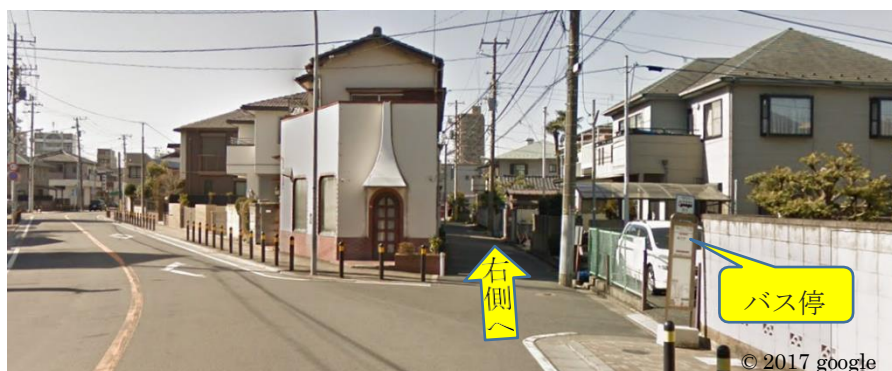
市川2丁目バス停付近