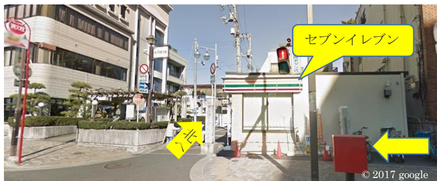
国道14号線の歩道、大門通りの入り口